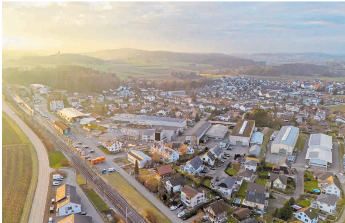
Rickenbach im Zürcher Weinland aus der Vogelperspektive mit Blick auf die Solaranlage der Wegmüller AG – ein Teil ihres überschüssigen Solarstroms wird über eine LEG mit dem Dorf geteilt.

Jetzt informieren und anmelden: www.ekz.ch/gemeinsamstrom