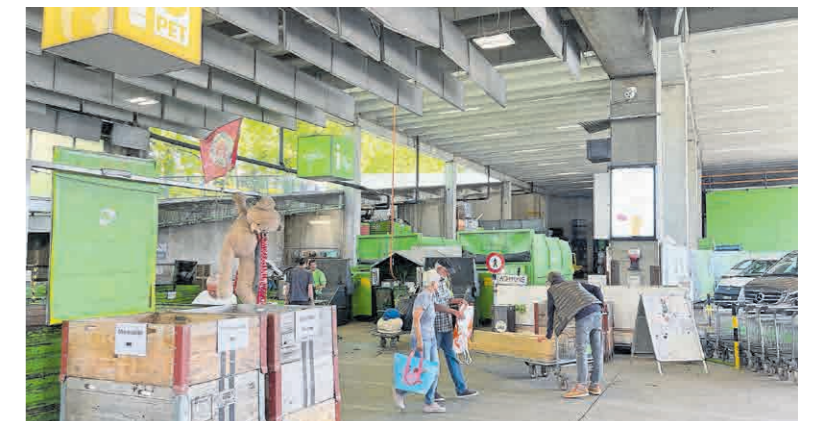
Emsiges Treiben auf dem Recy-Hof – quasi der Vorstufe des Recyclings.

weniger brauchen. Und wenn damit gepriesen wird, dass Möbel noch für Fernwärme verbrannt werden, dann sei das keine Werbung, sondern die letzte aller möglichen Downcycling-Varianten. «Es gibt Tage, an denen es wehtut – und Tage, an denen es mich anspricht, weiterzumachen.» Da drückt dann auch die Umweltnaturwissenschaftlerin in ihr durch. Gerade solche Auszeichnungen wie der This-Priis sporne sie an, «eine Wirtschaft zu denken, die menschlicher ist, die anders ist».