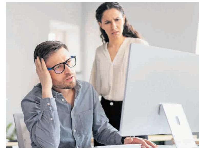
106 Prozent mehr Pleiten als im Vorjahr: Neu gelten härtere Regeln.

Wie kann das sein, dass derart viele Firmen – hochgerechnet über 10 000 pro Jahr – nicht überleben? «Der Grund dafür sind meist Liquiditätsengpässe, kombiniert mit einer unzureichenden finanziellen Führung. Gerade kleinere KMU