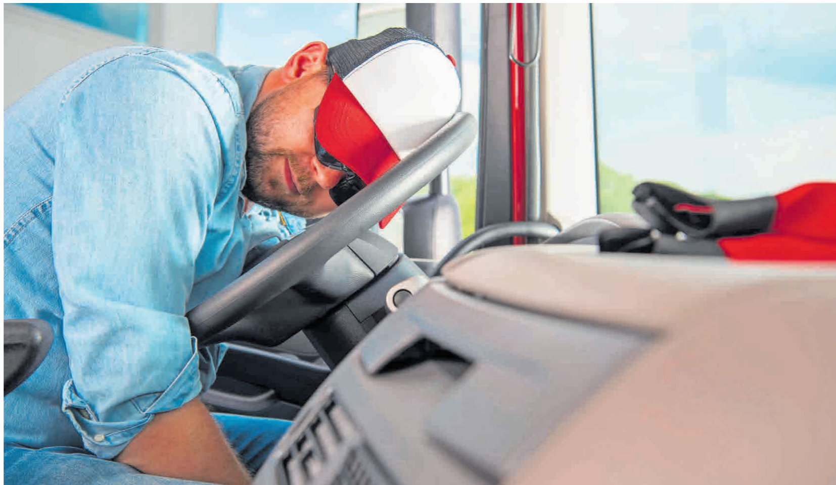
Zu den Risikoberufen, bei denen Schlafmangel schwerere Unfallfolgen haben kann, gehören jene in der Transportbranche.