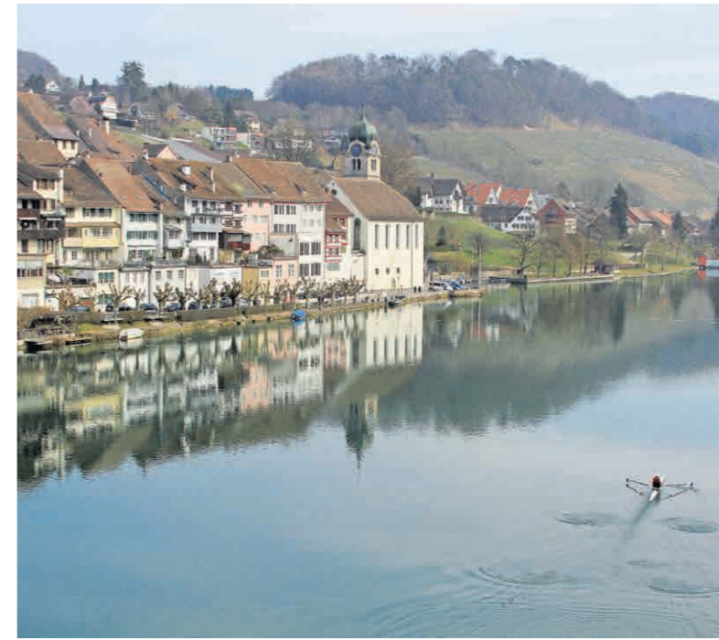
Der Umbau eines Schutzobjektes ist rechtlich anspruchsvoll und erfordert ein sorgfältig abgestimmtes Vorgehen.

Neben der Verfügung existiert im Kanton Zürich auch die vertragliche Unterschutzstellung. Diese setzt jedoch voraus, dass sich die Eigentümerschaft mit dem Schutz einverstanden er-