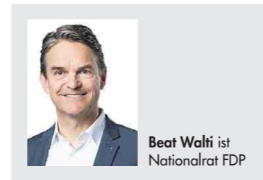
Beat Walti ist Nationalrat FDP

Zürich braucht keine starren Vorgaben und Arbeitsmarktbürokratie, sondern Lösungen, die funktionieren. Darum: Nein zur Initiative zur 10-Millionen-Schweiz.