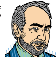
Philosoph, Physiker, Autor lhasler@duebinet.ch

Digitalisierung ist wie ein Tsunami.» Sagte Bundesrat Johann Schneider Ammann am ersten Digitaltag Schweiz. Ich stand mit ihm auf der Bühne – und reagierte spontan: «Dann rennen wir am besten sofort los.»